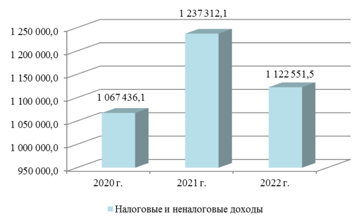
Диаграмма 3 (тыс. рублей)

Структура ожидаемого исполнения доходов бюджета Республики Карелия в 2022 году по Министерству в части налоговых и неналоговых доходов (1 122 551,5 тыс. рублей) представлена на диаграмме 4.