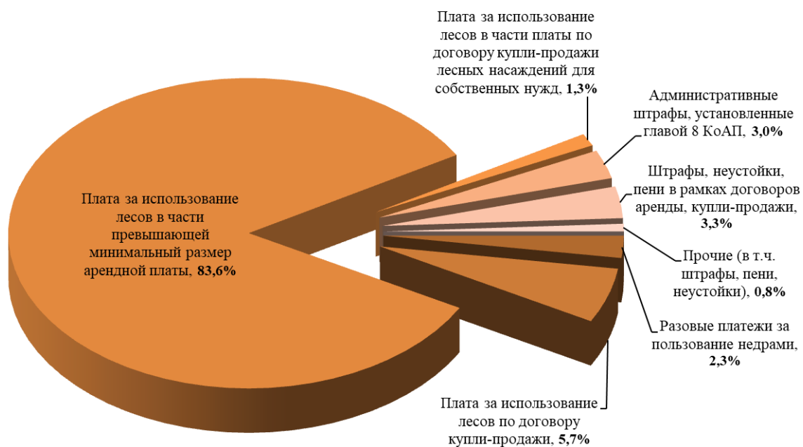
Диаграмма 1 (процентов)