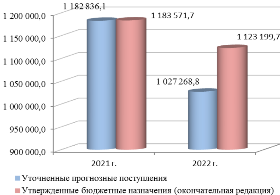
Диаграмма 2 (тыс. рублей)

Исполнение налоговых и неналоговых доходов бюджета Республики Карелия за 2020-2021 годы и ожидаемое исполнение указанных доходов за 2022 год (по доходам, администрируемым Министерством) представлено на диаграмме 3.